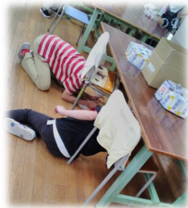
つくえの下に隠れて！