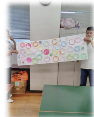
綺麗にできました(´0´)／