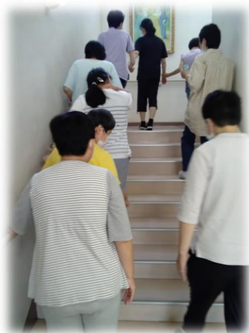
ゆっくり階段上がってくださいー！