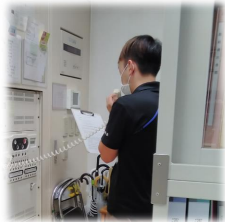
マイクのテスト中～

去年が大雨警報で中止になり、2年ぶりの訓練参加だったので、改めて色々なことを再確認する良い機会になりました。