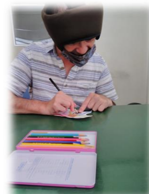
細かいところも丁寧に。