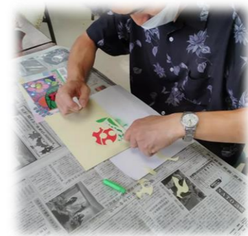
慎重に砂を落とします。