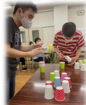
紙コップでもぐらたたきもしました。