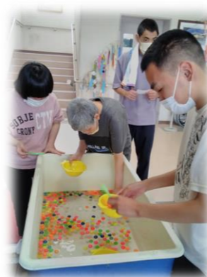
たくさん すく 揃うぞ～！