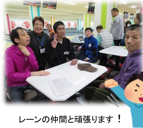
レーンの仲間と頑張ります！

みんなストライクやスペアを狙って投球！ ストライクやスペアが出ると、「キヤー！」 「ワァー！」「嬉しい～」と仲間にハイタッチ♪