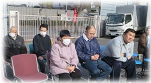
準備万端！まだかな～