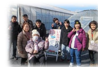
いちごハウス前でパシャリ☆