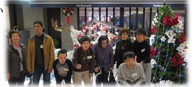
クリスマスツリーと記念撮影