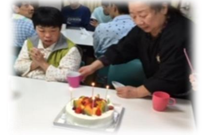
ろうそくに火をつけて…

「次はバーベキューやなあ」と、春のイベントが待ち遠しいようで、早速「どんなのにする？」と話が盛り上がっています！