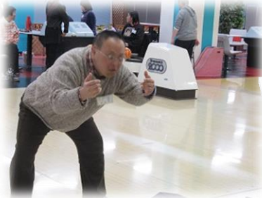
ストライクの予感！？