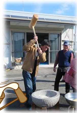
さまになってますね(^_^)v

順番に杵をもって『よいしょ、よいしょ。』の掛け声のもと力一杯ついていました。『楽しかった。まだつきたい。』との声もありましたが、時間いっぱいとなり終了となりました。また、来年やりましょう～！！