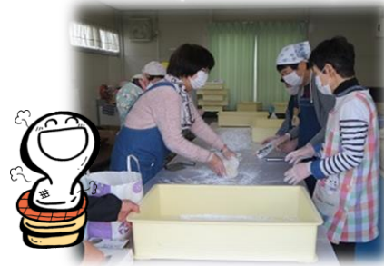
おもちを丸めてくれています♪